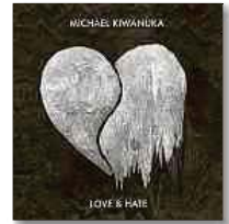
Michael Kiwanuka Love & Hate Polydor / Universal 10 Songs, 55:02 min. www.michaelkiwanuka.com

Michael Kiwanuka hat es fast einmal nach Luxemburg geschafft. Es war im November 2015. Der Redakteur freute sich. Das Erstlingswerk „Home Again“ des Soulsängers aus London bestach durch eine markante Stimme, nostalgische Texte und dazu ein Hauch Welterschmerz – perfekt. Doch dann veränderte der IS über Nacht die Welt. Bomben und Kalaschnikows in Paris. Das geplante Konzerte wurde wie der restlichen Shows des „Sonic Visions Festival“ in der Rockhal abgesagt. Schock, Trauer und Verunsicherung.