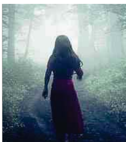
Die Oper „Alceste“ eröffnet das Festival.